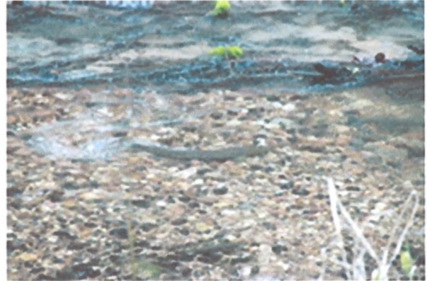
преграды на Тартаке